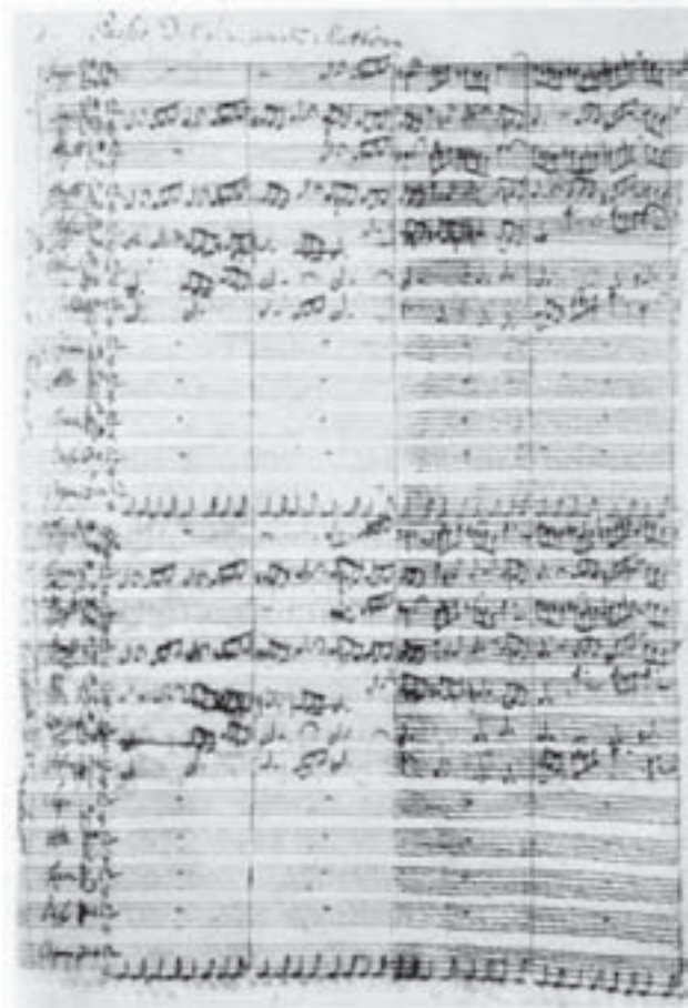
Matteus-passion käsikirjoituksen ensimmäinen sivu v. 1729.