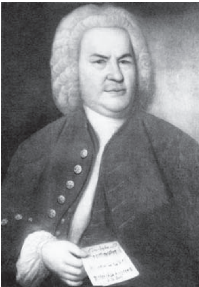
Johann Sebastian Bach. E. G. Hauffmannin öljymaalauk v. 1746.